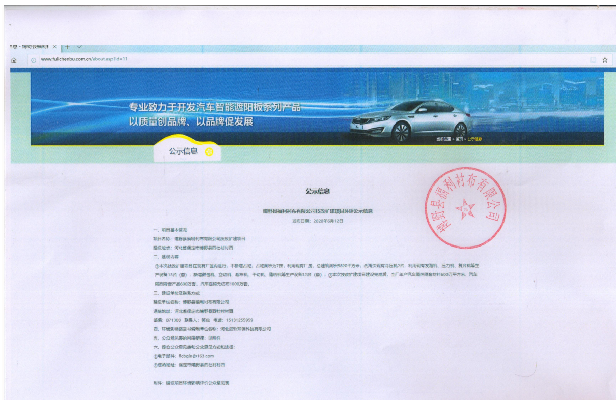
图 2-1 项目首次环境影响评价信息网络公示图