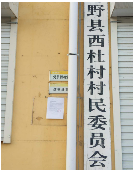
图 3-4 西杜村张贴照片

本项目环境影响报告书征求意见稿采用张贴公告的方式进行，信息公开起止日期为2020年8月27日—9月9日，时间为10个工作日。环境影响评价信息张贴在西杜村村委会公示栏，符合《办法》第十一条建设项目所在地公众易于知悉场所选择的要求。